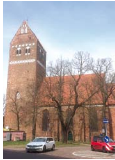
↑↓ St. Marienkirche