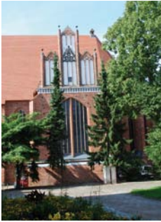
↑ St. Georgenkirche