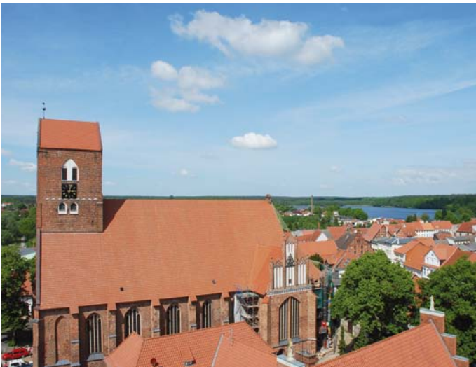
↓ St. Georgenkirche mit dem Wockersee im Hintergrund

Nachdem die Stadt Parchim um 1200 das Stadtrecht erhalten hatte, wurde die St. Georgenkirche bereits 1229 erstmals erwähnt. Das noch spätromanische Bauwerk ohne Turm und Querschiff brannte 1289 völlig ab und wurde durch den um 1307 geweihten gotischen Neubau ersetzt.