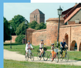
Alte Bischofsburg Wittstock