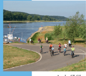
Auf der Elbfähre

Ausgangspunkt der Rundtour durch die Elbauen und die Lenzer Wische ist die Burg Lenzen. Durch den historischen Stadtkern des malerischen Städtchens führt die Tour an die Elbe und in die Wischedörfer. Vom Elbdeich aus beeindruckt die Natur im UNESCO-Biosphärenreservat Flusslandschaft Elbe-Brandenburg zu jeder Jahreszeit. In Wootz führt die Tour weg von der Elbe in die weite Landschaft der Wische und lädt zu Abstechern nach Kietz zum Slawenwall oder ins Künstlendorf Breetz ein. Ein Bad in der Löcknitz bei Seedorf oder ein Besuch des Quitzow-Speichers in Eldenburg ergänzen die Naturerlebnisse auf der ruhigen Tour, die an der Burg Lenzen endet.