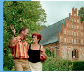
Kloster Stüt zum Heiligengrabe