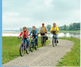
Auf dem Elbdeich

In Bad Wilsnack am Bahnhof oder am Markt mit der Wunderblutkirche beginnt die Tour in die Nahrungsgebiete des Storchs. Durch weite Felder und Wiesen führt der Weg über Abbendorf an die Elbe und zur Havelmündung an das Gnevsdorfer Wehr. Das Europäische Storchendorf Rühstädt ist jährlich Schauplatz für das Familienleben von mehr als 30 Storchenaaren, die ihre Nahrung in den Elbauen und der Karthಾನeniederung finden, durch die die Tour führt. In der Storchensaison lässt sich Freund Adebar allerorten sehen, auch der Vogelzug bietet im Herbst und Frühjahr ein beeindruckendes Schauspiel. Über Groß Lüben geht es zurück nach Bad Wilsnack.